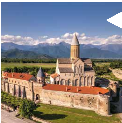
Circuit en Géorgie du 12 mai au 22 mai 2025